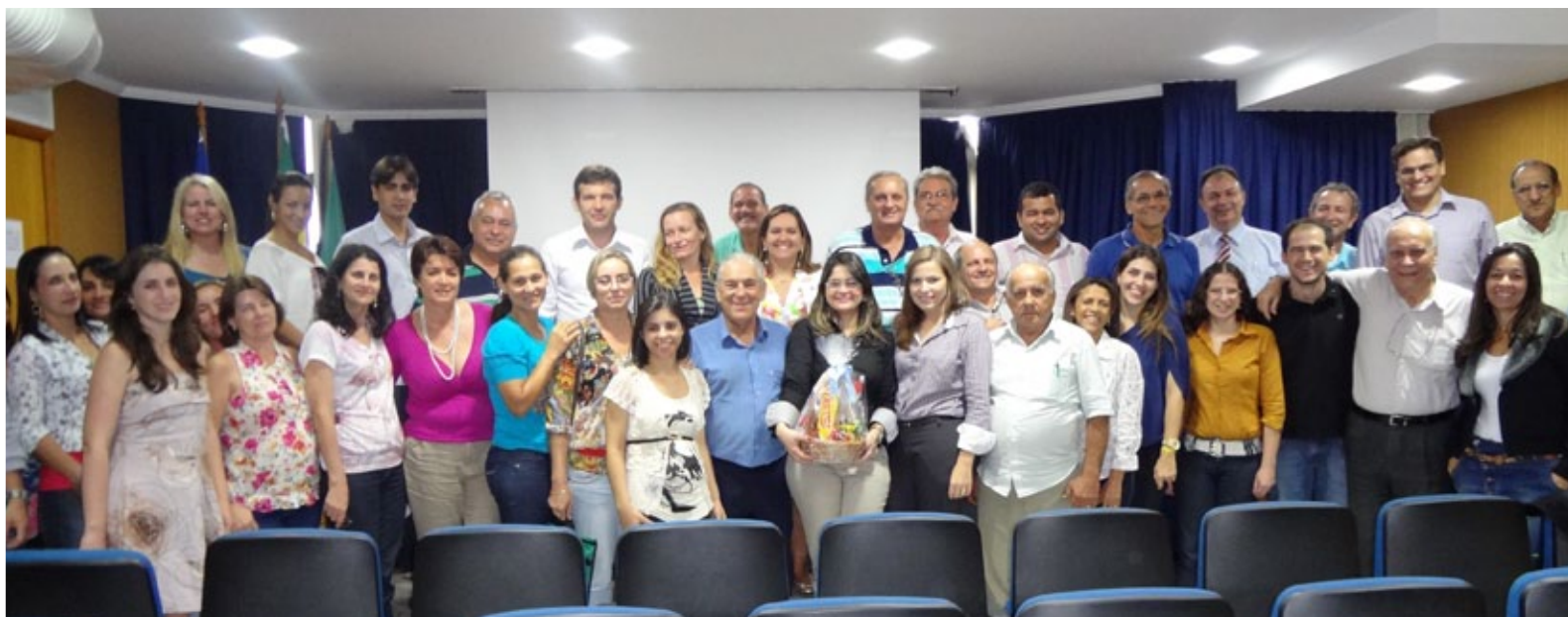
A declaração para aposentadoria rural poderá ser requerida pelo segurado especial no valor de 1 salário mínimo

Sindicatos rurais são treinados para emitir declaração para fins de aposentadoria aos produtores que exercem atividade em regime de economia familiar