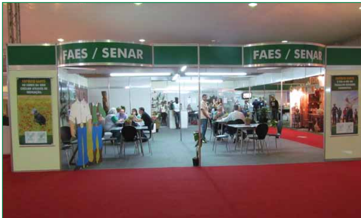
O estande da Faes e Senar/ES foi ponto de encontro dos produtores rurais

A 35ª edição da GranExpoES foi um sucesso. Responsável por movimentar um volume de negócios superior a R$ 45 milhões, a feira, que aconteceu no período de 10 a 14 de agosto, no Carapina Centro de Eventos, na Serra, recebeu mais de 110 mil visitantes. O estande da Faes e Senar/ES foi uma das atrações do evento.