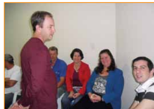
O encontro abordou assuntos de interesse da classe agropecuária

presidente do sindicato de Rio Novo do Sul, feliz em receber o Seminário Propriedade Ativa em seu município.