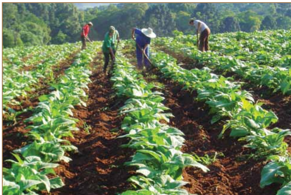
A falta de capacitação dos trabalhadores está presente em várias regiões

Um dos grandes problemas enfrentados pelos produtores rurais é a falta da mão de obra especializada nos campos da agropecuária do país. A dificuldade em encontrar trabalhadores qualificados e operários braçais está cada vez maior.