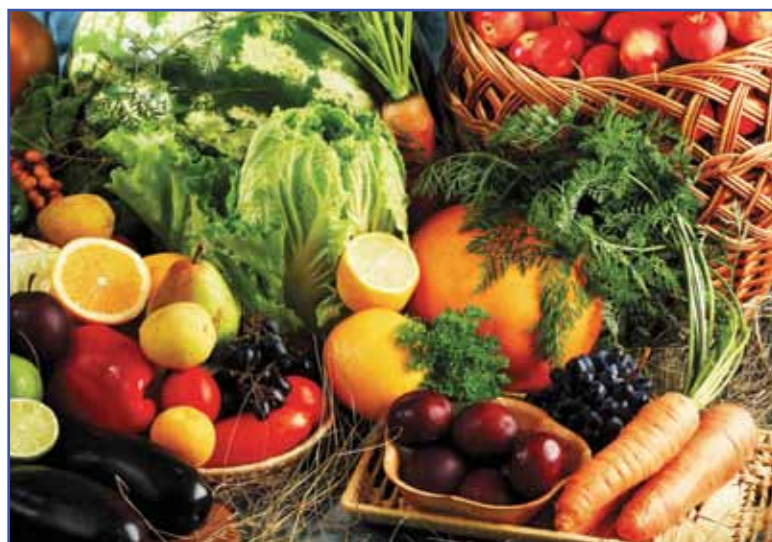
Famílias gastam, em média, 6,2% da sua renda com a compra de frutas, legumes e verduras

Para a senadora Kátia Abreu, presidente da CNA, os produtores brasileiros têm condições de produzir mais, desde que a fruticultura possa contar com políticas específicas para o setor. Entre 2006 a 2010, o Senar formou 140 mil pessoas para trabalhar com ativi-