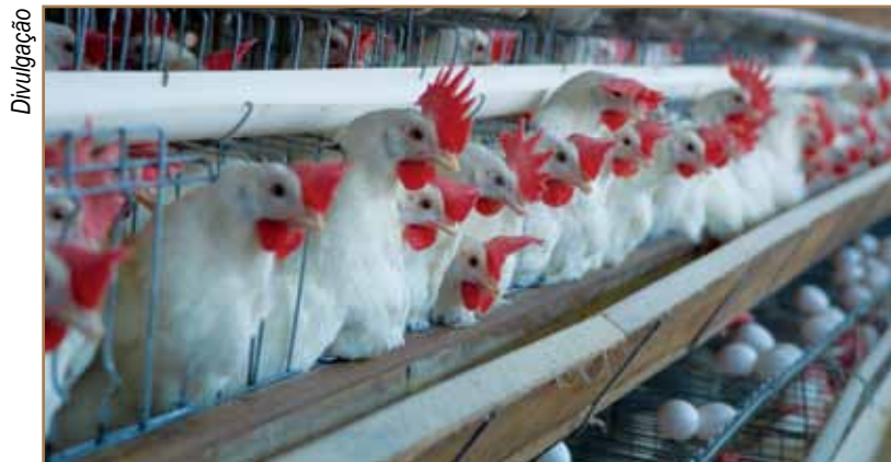
A avicultura é uma atividade comercial importante no contexto econômico do agronegócio brasileiro

Avicultura é tema de treinamento promovido pelo Senar/ES e parceiros