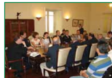
Encontro reuniu autoridades, no Palácio Anchieta