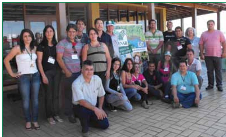
Treinamento aconteceu em Nova Almeida