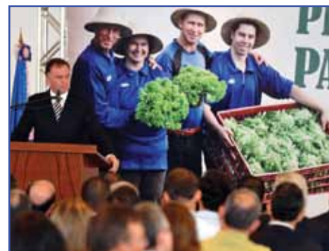
Programa vai destinar cerca de R$ 700 milhões para a agricultura familiar

A principal função do comitê é gerenciar e acompanhar as ações relativas ao desenvolvimento e a execução do plano. Outras entidades que têm representantes nessa comissão são Seag, Banestes, Bandes, Banco do Brasil, Banco do Nordeste e Fetaes.