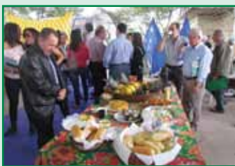
A reunião mensal de diretoria da

Faes aconteceu na GranExpoES e reuniu diretores da entidade e presidentes de Sindicatos Rurais. Em pauta, temas de interesse do homem do campo, como a renegociação de dívidas do setor cafeeiro e a eleição da CNA.