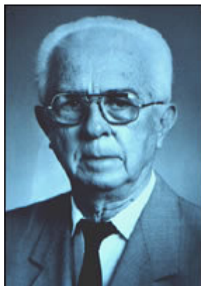
Presidente em exercício 1971-1976