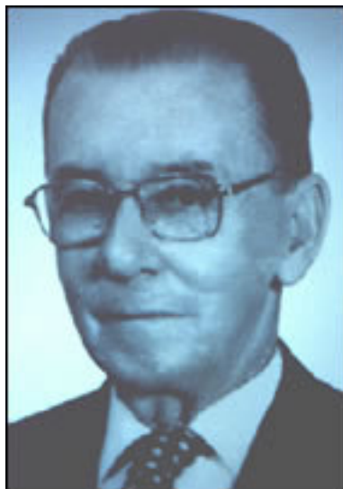
Presidente em exercício 1967-1970